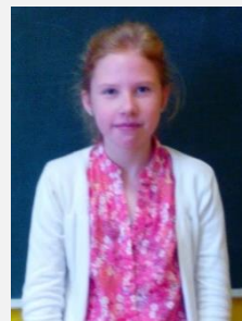
Ance 6.a informācijas grupa