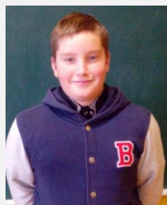
Kristis 6.a kultūras grupa