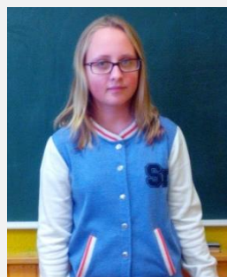
Vendija 7.a informācijas grupa