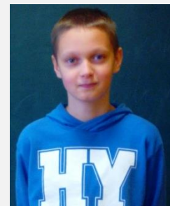
Sandis 6.a kultūras grupa